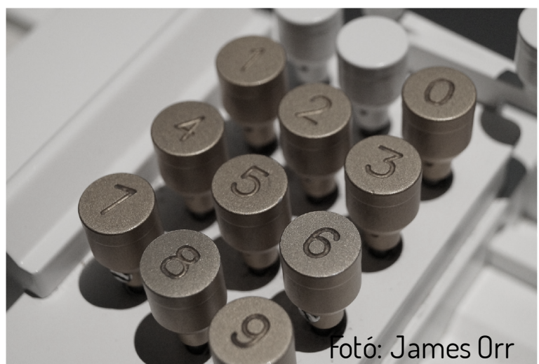
Fotó: James Orr